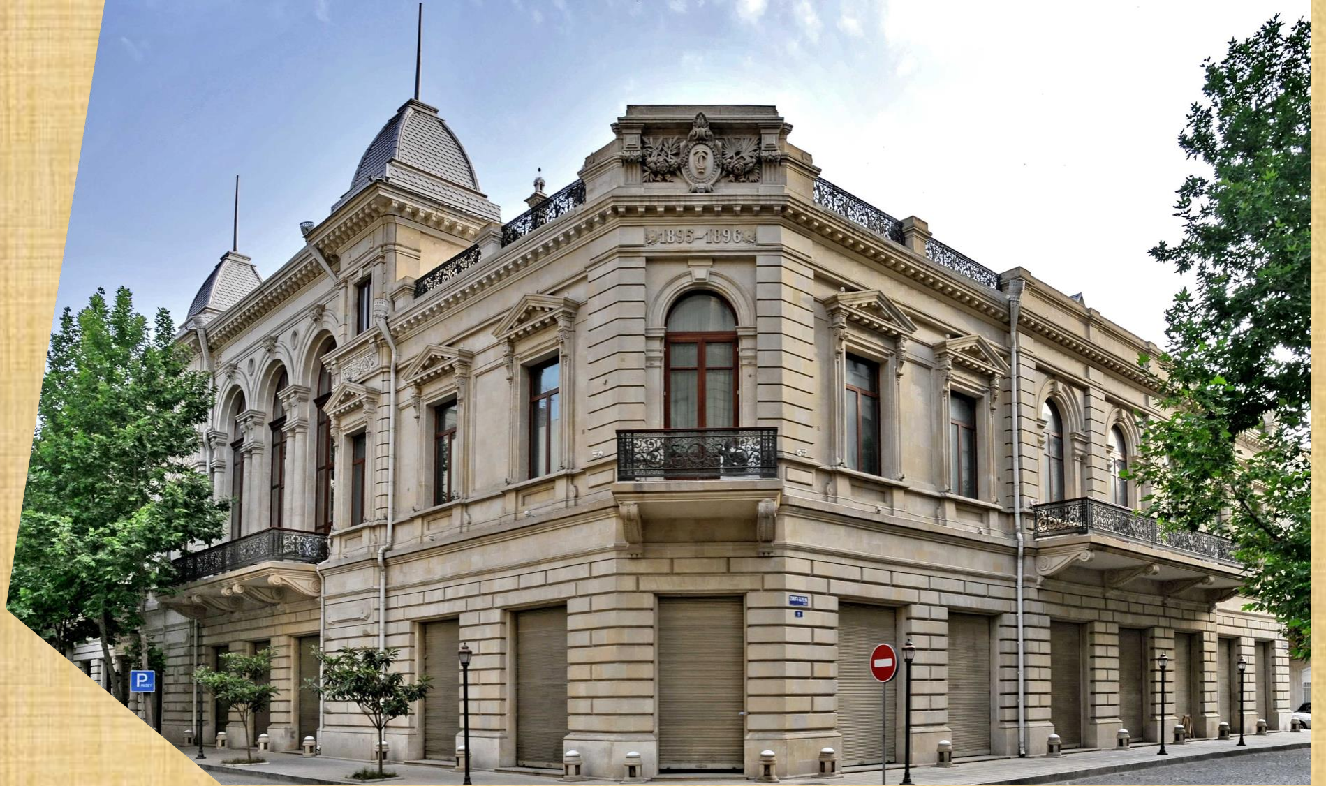
Facade of the building of the NMHA