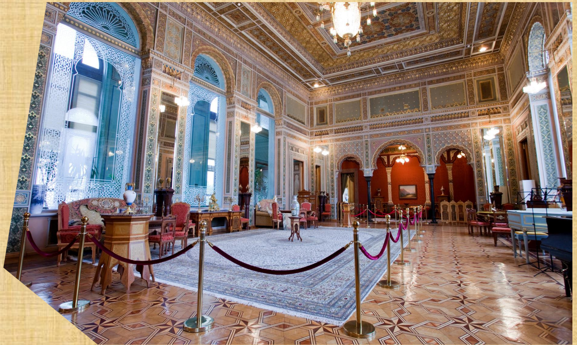
The Oriental Hall of the H.Z. Tagiyev Memorial Museum