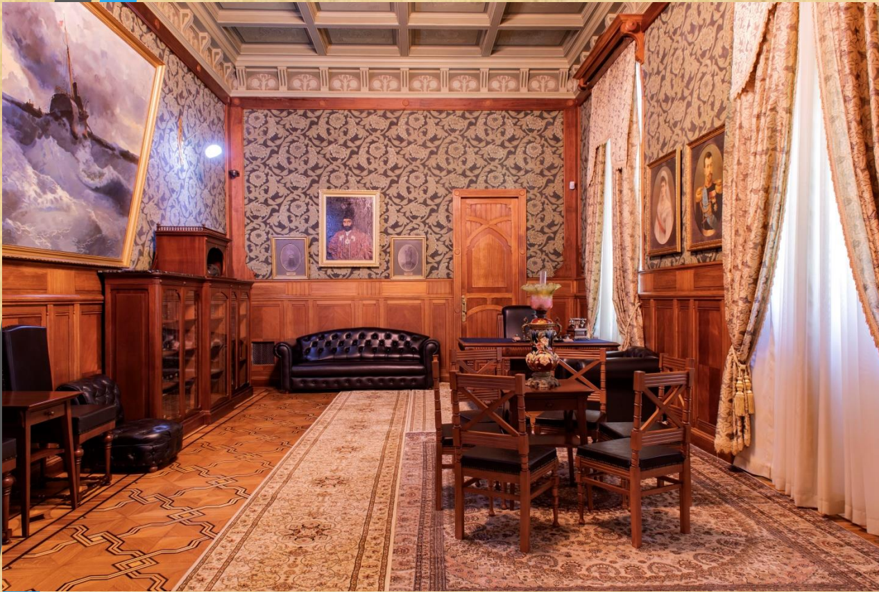
H.Z. Tagiyev's study